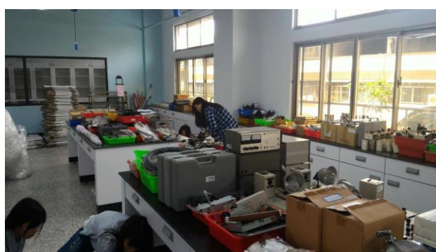
▲協助整理自然科實驗室