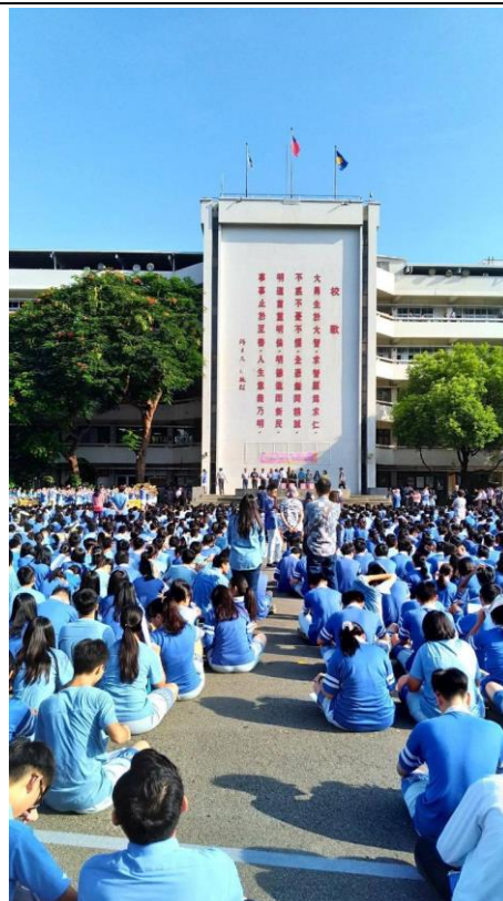
▲參與每週二朝會活動